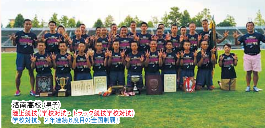
洛南高校 (男子) 陸上競技 (学校対抗・トラック競技学校対抗) 学校対抗、2年連続6度目の全国制覇!