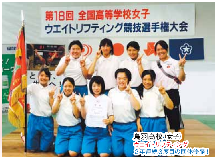
鳥羽高校 (女子) ウエイトリフティング 2年連続3度目の団体優勝!